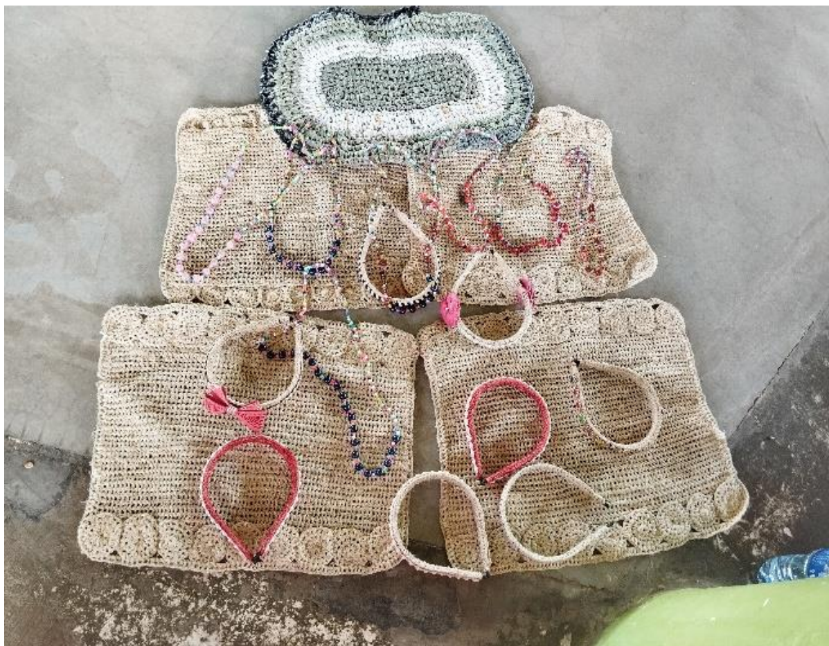
Figura 1. Produção artesanal a partir da fibra de croá