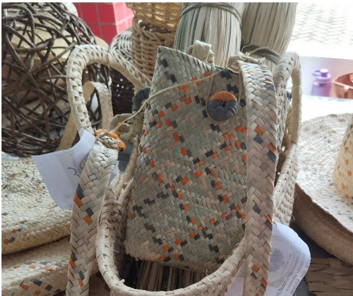
Figura 2. Produção artesanal a partir da fibra de croá