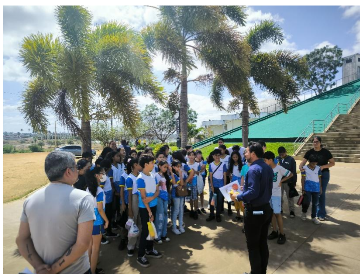
Figura 1. Estudantes classificando as palmeiras como a estrela.

observarem a árvore que deu nome à cidade, pois existem poucas árvores de Arapiraca espalhadas pela cidade e se tornou um momento importante de representação de nossa cultura e entender um pouco mais sobre as características dessa espécie que se adapta a lugares de clima com temperaturas mais elevadas.