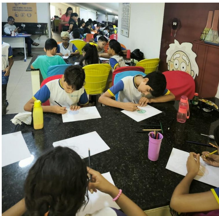
Figura 2. Oficina de astroarte no Brinca Ciência

Algumas limitações na produção dos desenhos dos planetas gasosos podem ser entendidas devido ao tempo de atividade na área externa exposta ao sol, o que pode gerar cansaço e fazer com que os estudantes não prestem atenção às informações durante as atividades.